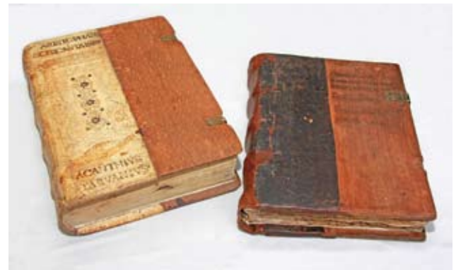
Inkunabulai iš Lietuvos mokslų akademijos Vrublevskių bibliotekos.