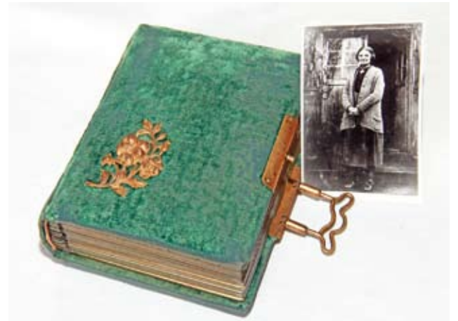
Asmeninis Šatrijos Raganos fotografijų albumėlis, saugomas Lietuvos mokslų akademijos Vrublevskių bibliotekoje.

Pagal R. Darntono knygos kelionės visuomenėje grandinę turėtų klostytis ir būsimojo knygos muziejaus naratyvai (pasakojimo plotmės), rodantys, kaip, pradedant autoriumi, jo kūrimu, per spaustuves (leidyklas), asmenines bibliotekas, knygrišyklas skleidžiasi Lietuvos (ypač istorinės Lietuvos, LDK) knygos kultūra, kokie iškiliausi raštijos ir knygos paminklai įvairiais istorijos laikotarpiais buvo sukurti, kokios jų istorijos („nuotykių“), kuo jos gali būti patrauklios šių dienų lankytojui ir pan. Greta bus pinami įvairūs mažieji pasakojimai, papildantys ir pagilinantys didžiuosius. Antai temos „Raštas ir knyga LDK iki spaudos atsiradimo“ jungiamasis elementas